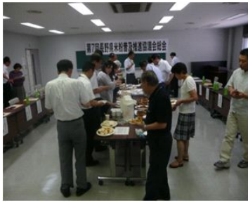
新作の米粉パンや米粉洋菓子(4業者8品目)を試食

6月29日(水)、長野第二合同庁舎1階共用会議室において、標記の総会が開催され、平成23年度の活動方針に対する活発な意見交換や、会員提供の米粉食品の試食等を通じて会員相互の情報共有を行い、一層の米粉の利用拡大を推進することを確認しました。