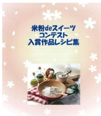
埼玉県米粉利用食品推進連絡会

埼玉県米粉利用食品推進連絡会は、多くの方に米粉利用食品を身近に感じていただくため、9月から11月までの間に開催した「米粉deスイーツコンテスト」において受賞した10作品のレシピを取りまとめた標記レシピ集を作成しました。