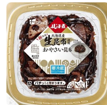
生昆布を使用した商品