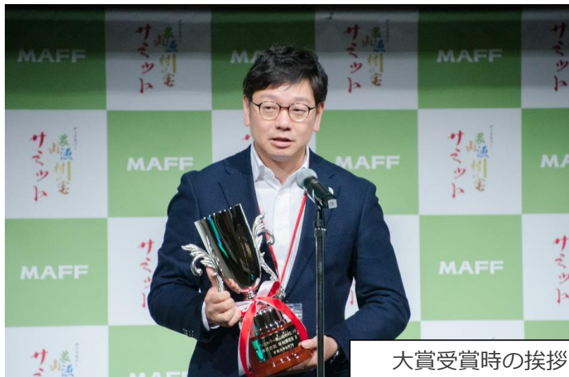
大賞受賞時の挨拶