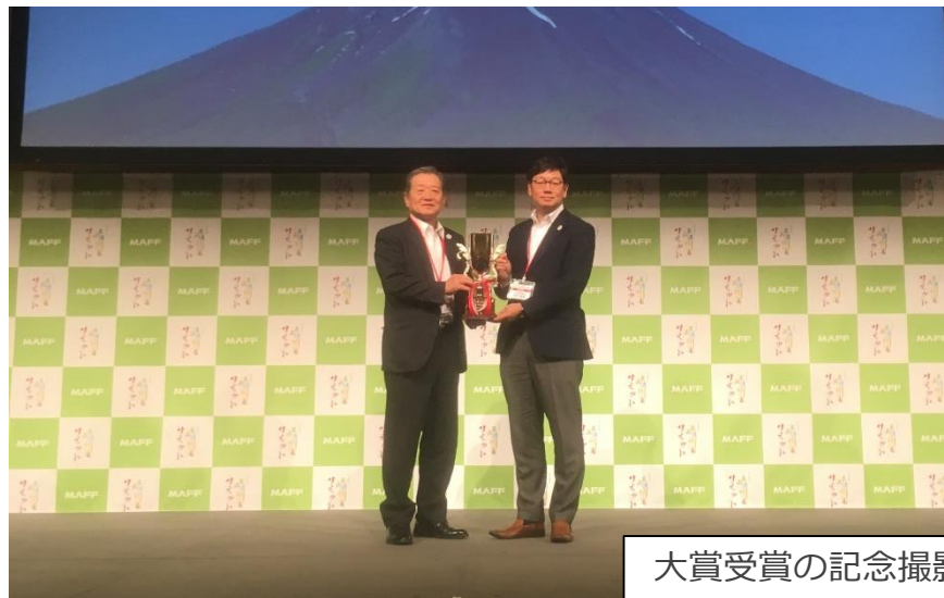
大賞受賞の記念撮影