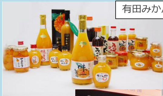
有田みかんの加工品