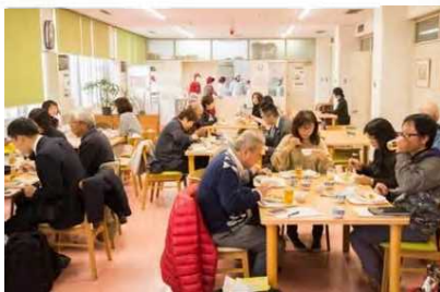
さんさん山城コミュニティカフェ