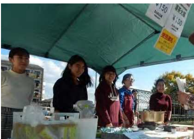
地元の大学生ボランティア