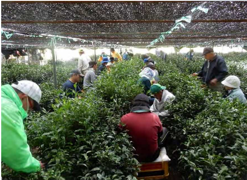
農業の様子（宇治茶の手摘み収穫）