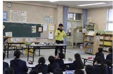
河南町内小学校での食育出前教室