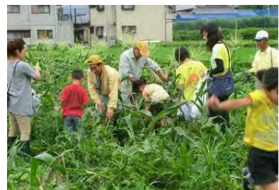
夏休み宿題応援イベント（収穫体験）