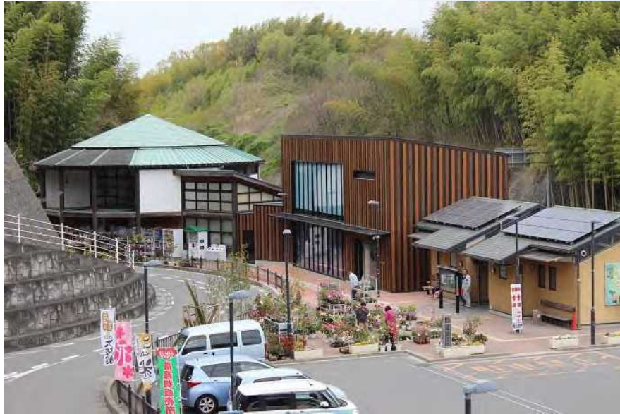
道の駅かなん及び直売所