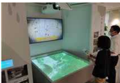
吉野川分水歴史展示館による新たな情報発信