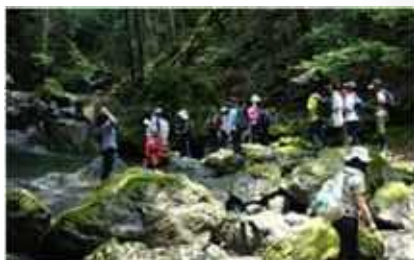
源流トレッキングツアー