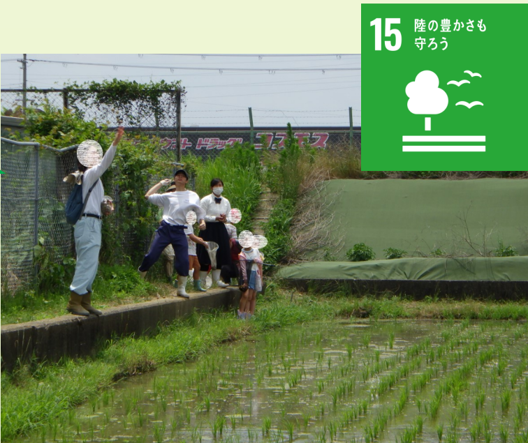
図4. 「いきもの観察会」での梅酒漬梅の投入