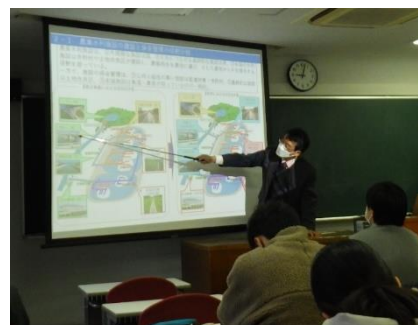
(京都大学での講義の様子)