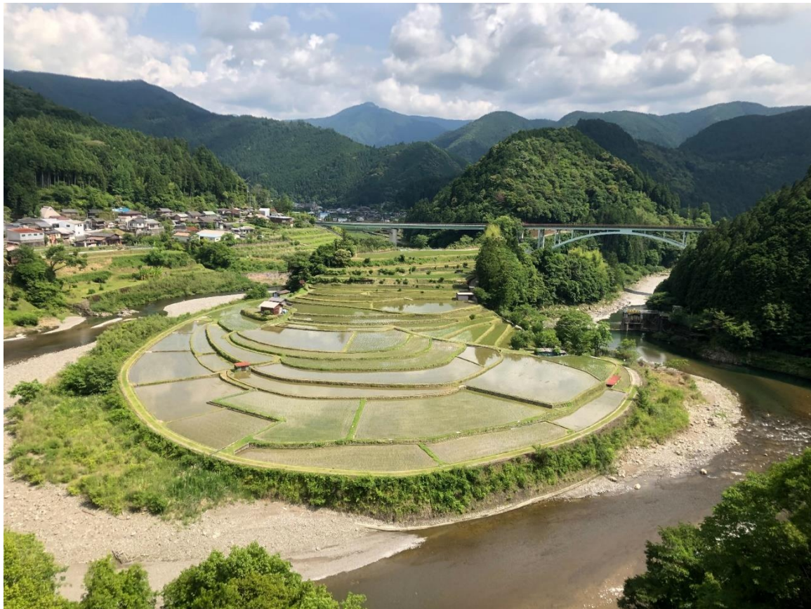
和歌山県有田川町あらぎ島の棚田