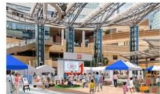
食から日本を考える。NIPPON FOOD SHIFT FES. 東京2022