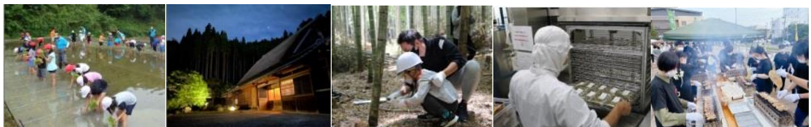
NPO法人里山 ひだまりファーム

近畿農政局「ディスカバー農山漁村（むら）の宝」第6回（令和4年）の選定地区（抜粋）