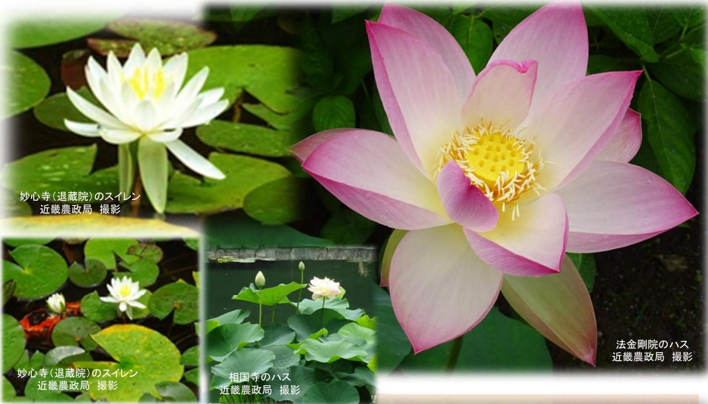
妙心寺(退蔵院)のスイレン