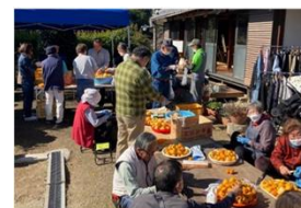
特定非営利活動法人おいわ結の里