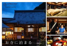
太田川流域農泊推進協議会