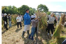
美原の古代米プロダクツ