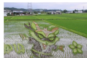
うしかい・甲南・信楽「ふるさと支え合い」 プロジェクトチーム