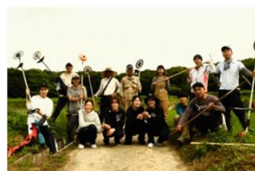
一般社団法人ため池みらい研究所