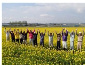
菜種栽培農家(滋賀県)