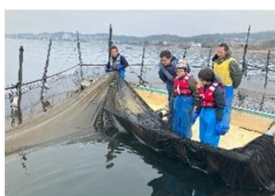
「びわ湖魚グルメ」開発プロジェクト