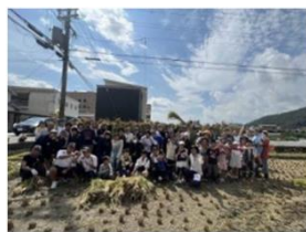
地域の方々と稲の収穫(兵庫県)