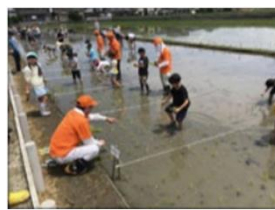
地域の子どもの農業体験(奈良県)