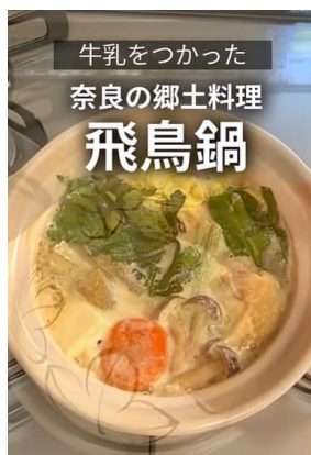
奈良の郷土料理・飛鳥鍋 (牛乳をつかった和風鍋)

冬になり、あま～いいちごが楽しめる季節になりました※ 今回は、近畿のいちご生産現場を取材しました！