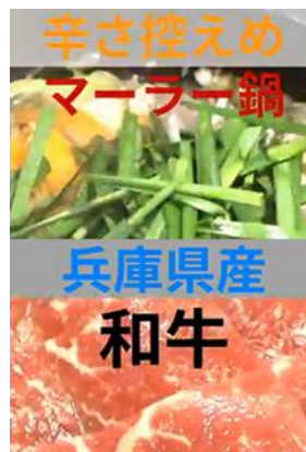
農水省に入った理由を語り ながら、マーラー鍋作り

YouTubeで公開中 近畿農政局ウェブサイトへ https://www.maff.go.jp/kinki/photo/kekka/video/b10.html