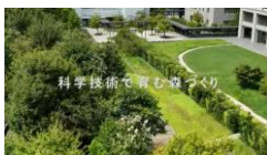
生物多様性保全賞