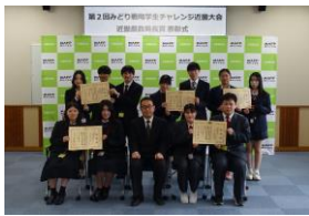
近畿農政局長賞 表彰式