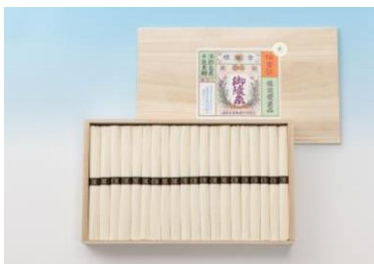
淡路島手延べそうめん

「淡路島手延べそうめん」は、麺の細さ、のどごしの良さ、コシの強さに加え、その上品な味わいや昔ながらの製法による希少性の高さなどが、そうめん専門店や老舗旅館等から高く評価されています。