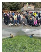
有限会社山口農園