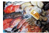
魚種に応じた鮮度保持技術で急速冷凍