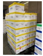
空輸用に梱包された商品