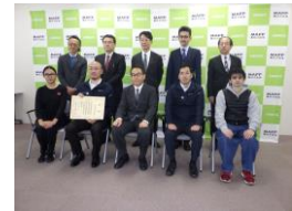
近畿農政局長賞の授与