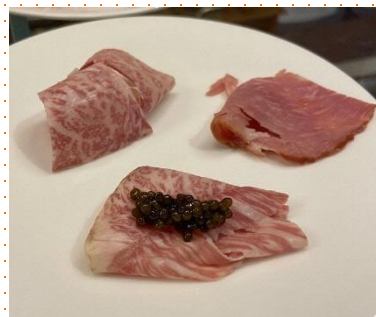
京都産和牛のハムとサラミ が現地(EU)で好評