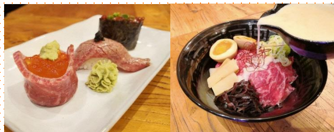
和牛を通じて日本の食文化を海外へ発信

◆ 活用した支援・施策: 「Kyoto Beef 雅」輸出拡大事業(平成27年度～令和3年度) 畜産物輸出コンソーシアム推進対策事業(令和3年度)