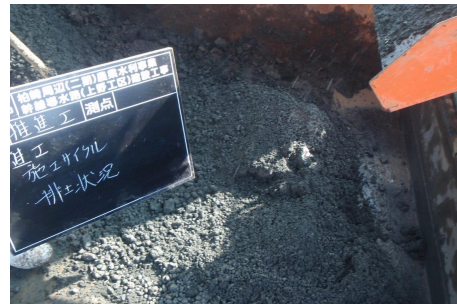
二次破碎された巨石・玉石