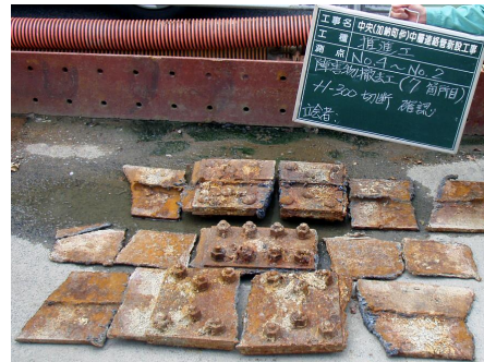
切羽で切断・回収された鋼材