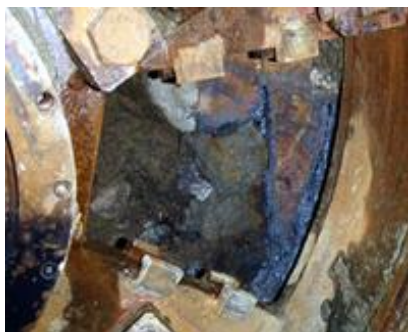
「点検扉」で確認されたH型鋼