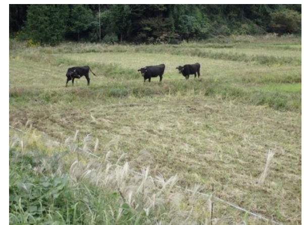
水田を活用した放牧