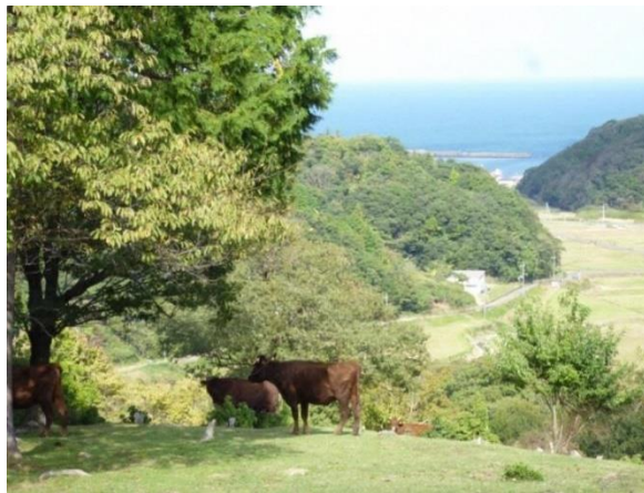
林地を活用した放牧