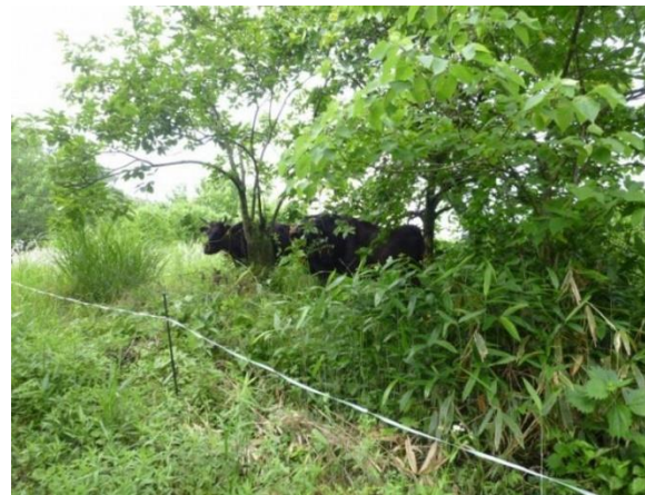
耕作放棄地を活用した放牧