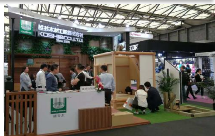
中国展示会に出展時の風景