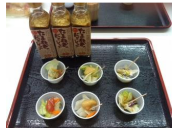
たまねぎドレッシングの試食販売