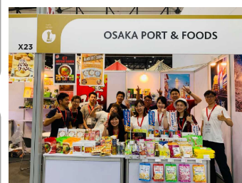
地域商社の仲間と展示会出展