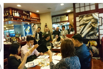
シンガポールでのプロモーションフェアの様子