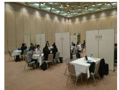
国内事業者様との商談風景