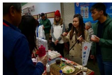
米国スーパーでの試食販促活動の様子