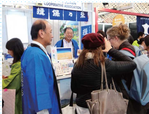
台湾イベントでのそうめん流し披露の様子