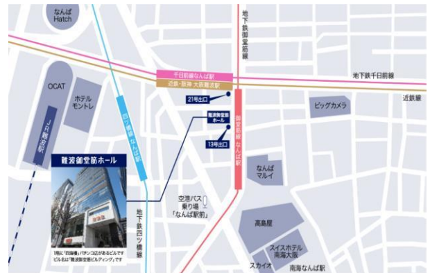
会場案内図(難波御堂筋ホール)

大阪メトロ 御堂筋線 なんば駅 中改札 13号出口から直結 南海本線なんば駅/近鉄奈良線 大阪難波駅 各徒歩約5分