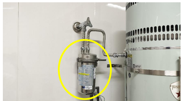
本館1～4階の湯沸室(近景)