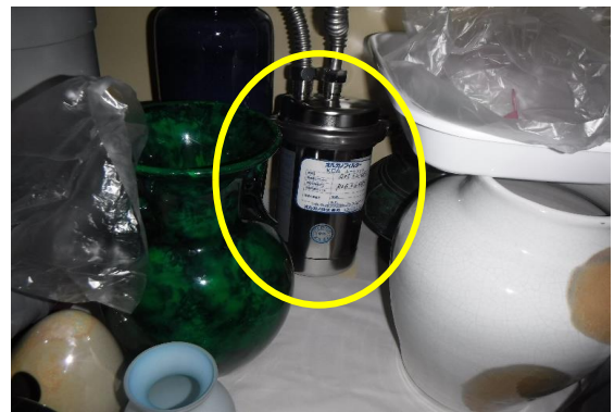
本館2階総務課の湯沸室(近景)