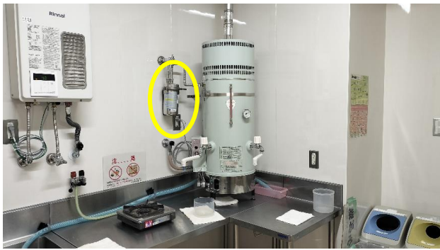
本館1～4階の湯沸室(遠景)