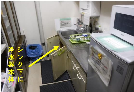
本館2階総務課の湯沸室(遠景)