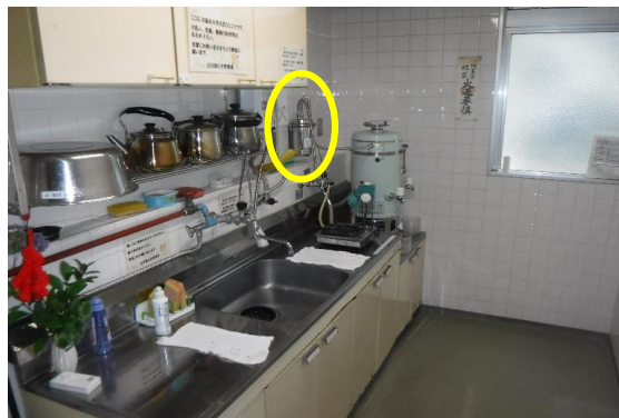
別館1～3階の湯沸室(遠景)