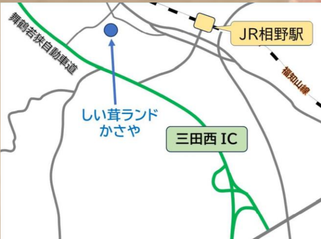
兵庫県三田市上相野373 JR相野駅より徒歩約10分 舞鶴若狭自動車道(三田西IC)より約5分

農作物の育ち方を知らない子どもが増えています。ここでの体験を通して、食を身近に感じ、興味を持ったり考えたりするきっかけになれば嬉しいです。