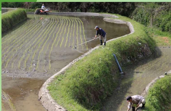
奈良県桜井市「吉隠の棚田」