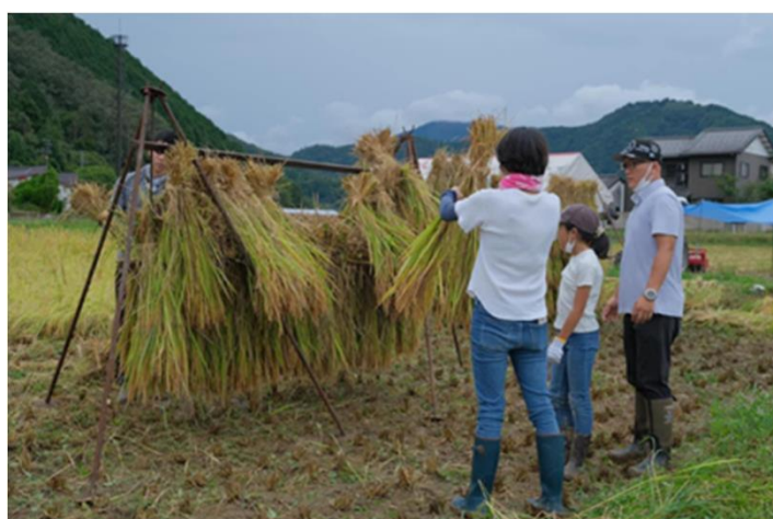
地域住民と都市部消費者との稲刈り交流会