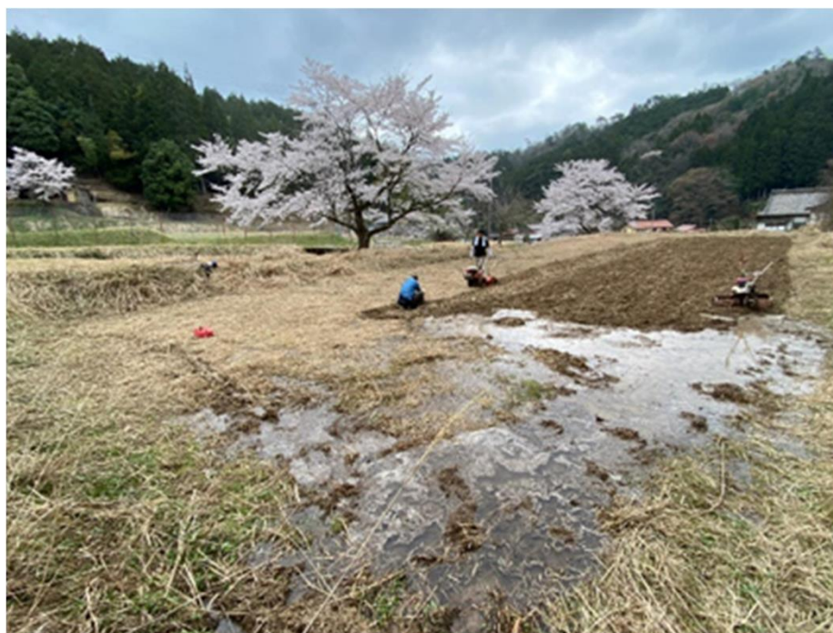
棚田耕作放棄地の復田作業