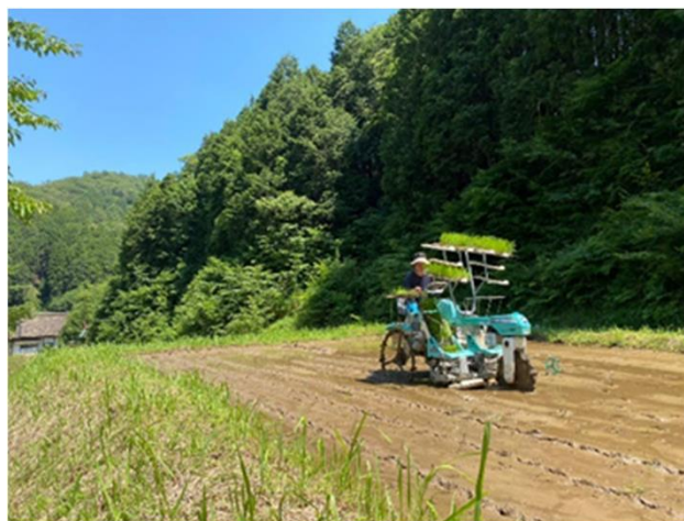
復田し棚田で田植え