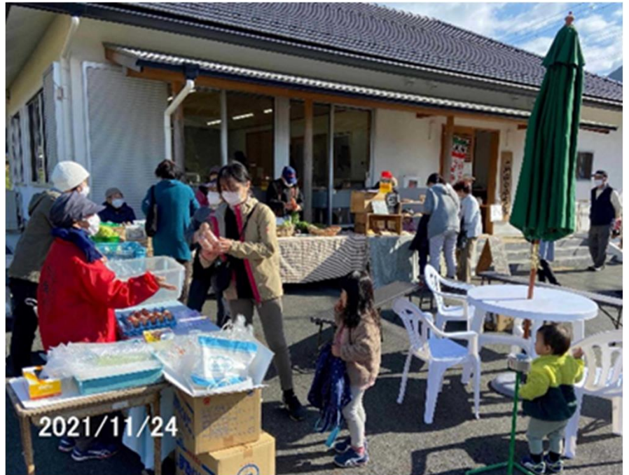
大路ファーマーズマーケット