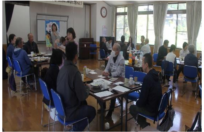
大路の移住者との交流会