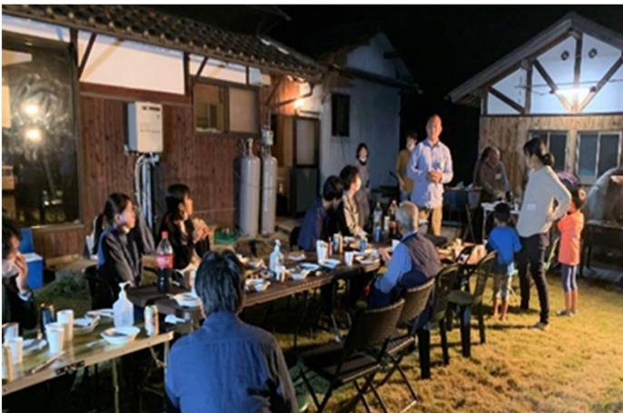
大学生との交流会