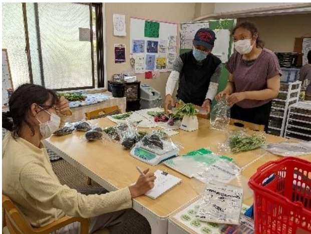
収穫した野菜の整理、計量、袋詰め