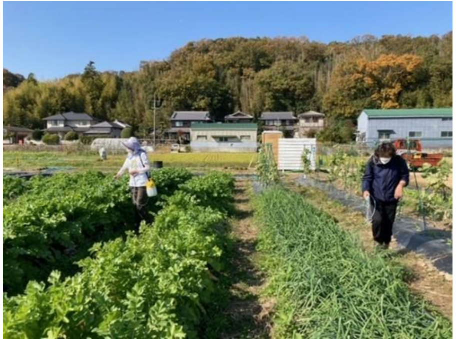
各人が得意な仕事を担当する。肥料や水撒き。