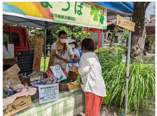
地域のイベントに参加し、野菜の販売を行う