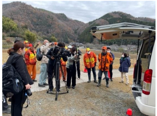
猟友会とドローンで獣害対策事業に取り組む