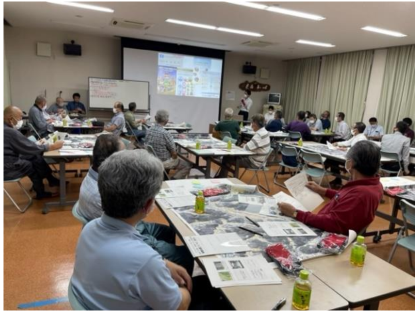
耕作放棄地等農地勉強会の様子