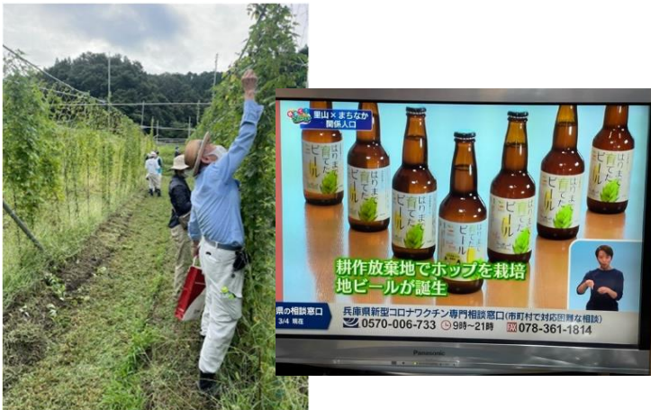
ホップ栽培とクラフトビールの様子