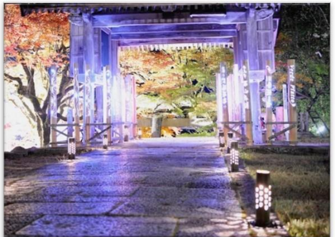
やぶもみじまつり会場