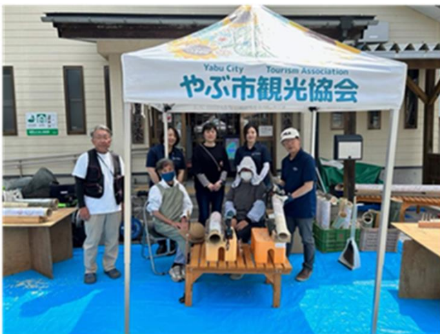
竹灯りサークルの制作会