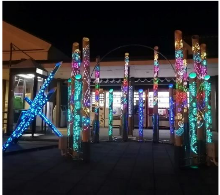
竹灯りサークルの夜間点灯