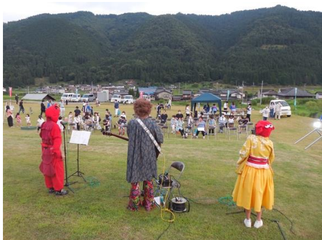
殿屋敷納涼ライブ（令和3年度）