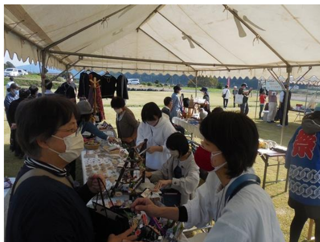
特産品を知ってもらうイベント（令和4年度）