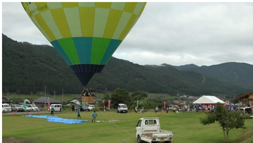
熱気球から史跡を見る（令和2年度）