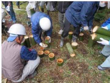
伐採した竹の植木鉢にドングリを播種