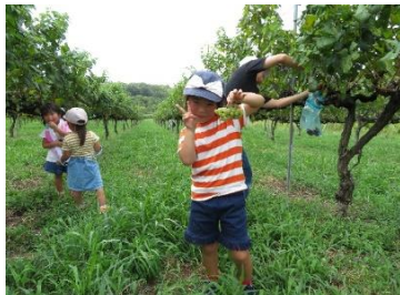
神戸ワイン専用ぶどうの収穫体験