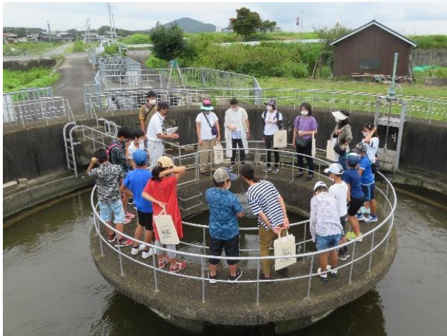
淡山疎水・東播用水親子学習会（円筒分水工）