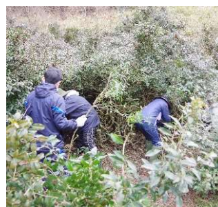
耕作放棄茶畑の再生

今後は、地域住民を主体とする「福の住む里協議会」を中心に、官民様々なステークホルダーが連携し、「持続可能な循環型の里山暮らしの実現」に向けた地域再生の取組を継続・発展させていきます。