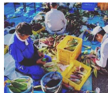
大和ルージュの収穫作業