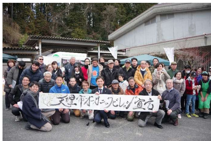
天理市オーガニックビレッジ宣言

こうした地域課題の解決に向け、「天理市オーガニックビレッジ宣言」に基づくこの地域を中心とした有機農業の推進を核とし、環境や教育連携、移住定住促進等の各分野において、「持続可能な循環型の里山暮らしの実現」を目指すプロジェクトを地域住民と官民連携により推進しています。