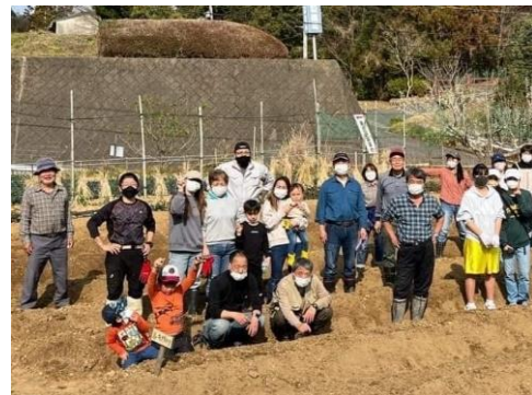
おおいわ結の里のみなさん

また、大淀町役場と連携し「大淀町農村の魅力づくりモデル事業」として農業塾を開催しています。