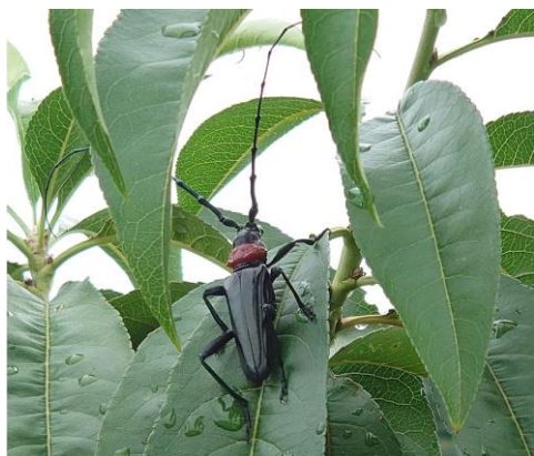
クビアカツヤカミキリ成虫