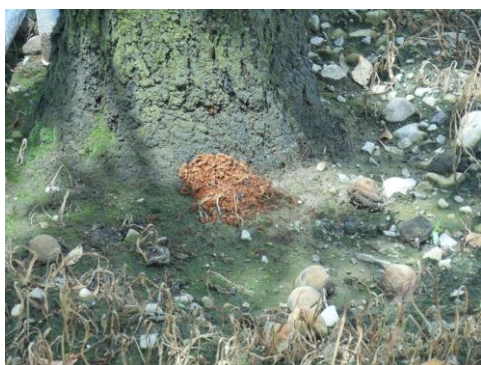
フラス（木くず）