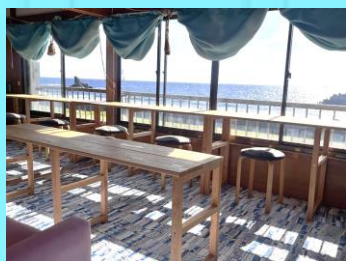
すさみの海を望む、開放感ある2階席