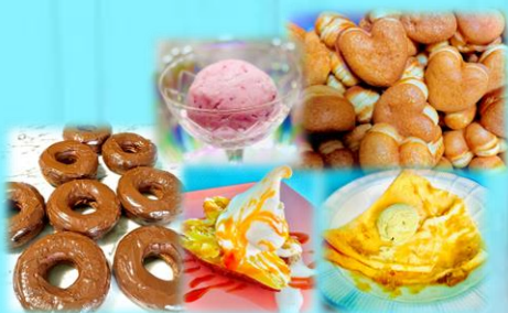
どれも気になる、かわいいスイーツ