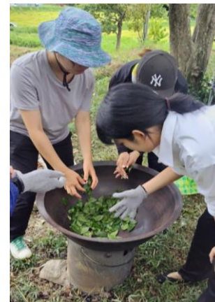
釜炒り茶づくり体験 https://njl.hp.peraichi.com/chatsumi/