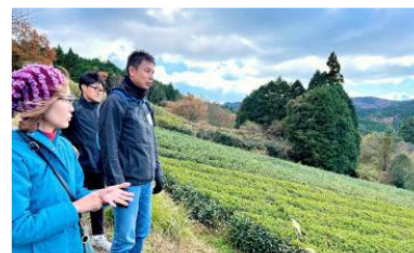
民間企業等の視察