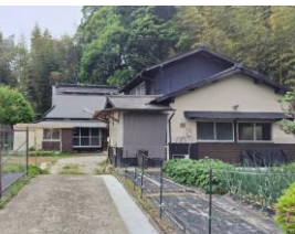
ライトハウス田原 (宿泊施設)