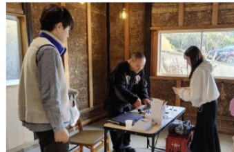
イベント参加者のアミラーゼとコルチゾールの測定