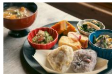
地元野菜のランチ