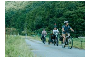
サイクリングツアー