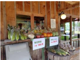
地域の農産物販売