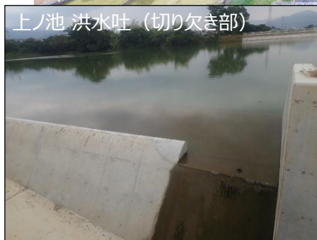
上ノ池 洪水吐 (切り欠き部)