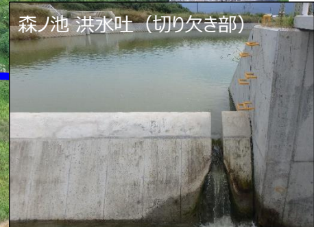
森ノ池 洪水吐 (切り欠き部)