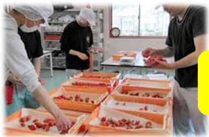
イチゴ班の選果作業