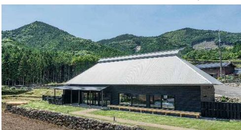
古民家ゲストハウス