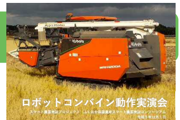
ロボットコンバイン動作実演会

こちら → https://www.maff.go.jp/kyusyu/fukuoka/katudou.html