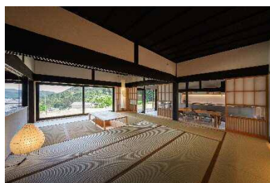
古民家ゲストハウス（内装）