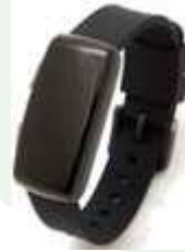
◀ウェアラブル端末