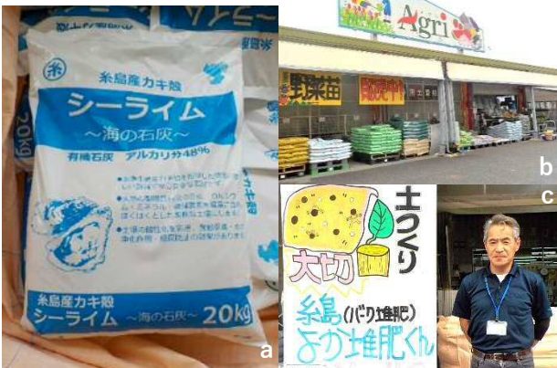
a：カキ殻石灰肥料（シーライム）。2010年に販売開始。b：JA糸島（アグリ店舗）。オリジナル資材も豊富。養殖中に死んだ牡蠣と地域のお困りものである竹を活用したバンブーシーライムも開発・販売。c：堆肥による土づくりの大切さも伝える。未利用資源である剪定枝を活用したパーク堆肥を2021年に商品化。

牡蠣小屋でお客様自身がカキ殻を分別し、牡蠣小屋事業者自ら、JF糸島(漁協)が設置した集積所へ運びます。それを石灰を製造する大坪GSI株式会社が有償で引き取り、粉碎、加工、包装し、肥料としてJAへ納入する仕組みです。カキ殻とその他のゴミを分別できるよう、2種類のバケツを牡蠣小屋の客席に設置する等、工夫し、皆様の協力を得ながら進めました。