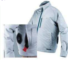
▲ファン付きウェア