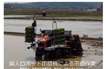
無人ロボット田植機による田植作業