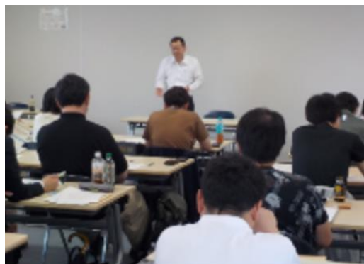
ご参加、ありがとうございました！

福岡県拠点は、5月16日、市町村の農政業務経験年数が短い職員を対象に、農政に関する研修を開催しました。市町村の農政担当部署では、農業経験が少ない者が担当になることも増え、地域の農業振興に苦勞しているという相談を受けたこともあり、開催に至りました。研修では、農林水産省の予算や新食料・農業・農村基本法について説明し、フリーディスカッションを通じて課題等を共有。参加者から、「今後の業務に活かすことができる」、「継続してほしい」等の感想をいただきました。