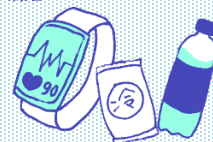
ウェアラブル端末、応急セット