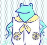
ファン付きウェア、ネッククーラー