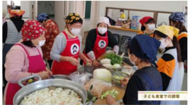
動画「糸島の愛とパワーをお届けします!」