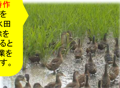
アイガモによる水稲除草

※ 合鴨水稲同時作とは、水田に合鴨を放すことにより、水田の除草、害虫防除を行い、合鴨も育てるといふ、農業と畜産業を同時に行うものです。