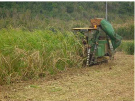
ハーベスターによる収穫