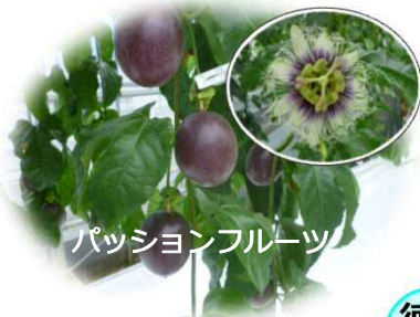
パッションフルーツ